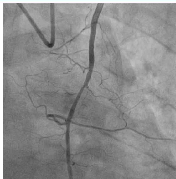
Figura 2 – ATIE com estenose após infusão de nitroglicerina.

ser atribuído à população usada como base por cada autor, visto que Sons et al., 17 Chen et al., 18 avaliaram pacientes candidatos à correção cirúrgica do miocárdio, como o presente estudo, diferente de Perić et al., 19 que selecionaram pacientes de forma aleatória. Todos os estudos apresentam um número reduzido de pacientes avaliados, o que dificulta tanto a homogeneidade dos dados, quanto a concordância entre a prevalência das lesões. O que fica claro é a necessidade de se avaliar a ATI, pré-operatória, em pacientes candidatos à CRM, visto que além de diagnosticar lesões que irão prejudicar a efetividade da CRM, também pode-se identificar possíveis alterações que causem consequências para os pacientes, como a isquemia de membros inferiores em casos de ATI atuando como circulação colateral, e a síndrome do roubo subclávio nos pacientes com oclusão ou estenose significativa da subclávia.