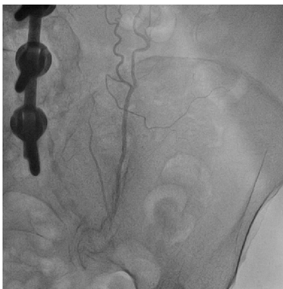
Figura 4 – Circulação colateral da ATIE para região pélvica.

circulação colateral para os membros inferiores por ATIE e epigástricas, foi demonstrado por meio de angiografia seletiva aorto-ílica a presença de lesões ateroscleróticas suboclusivas no local (Figura 5).