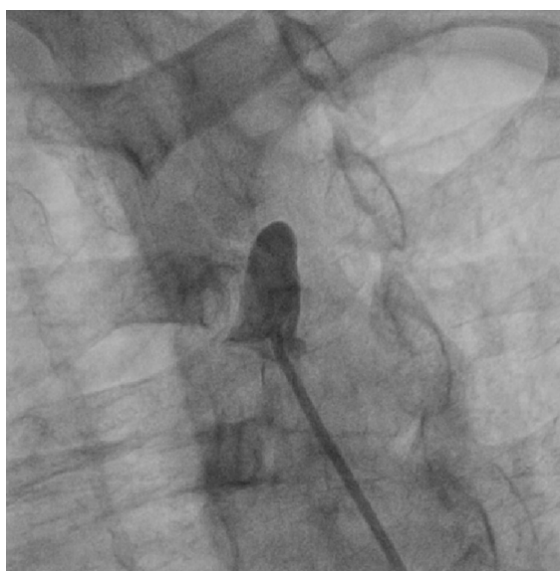
Figura 6 – Oclusão total da artéria subclávia esquerda.

do fluxo da artéria vertebral também estar direcionado para a subclávia, com sintomas como tontura, síncope e vertigem, devido à isquemia gerada pelo desvio da oferta sanguínea. Todo o quadro clínico gerado por essa fisiopatologia é chamado de síndrome do roubo subclávia, e esses pacientes podem ser triados tanto pela diferença de pressão arterial dos membros superiores, como pela pesquisa de sopros ao nível da subclávia, e diferença de pulso. Pacientes com oclusão total da