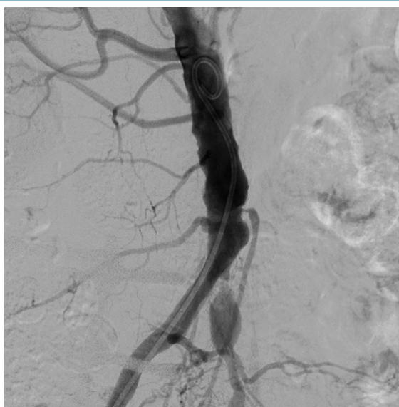
Figura 5 – Aorta com lesões ateroscleróticas suboclusivas.