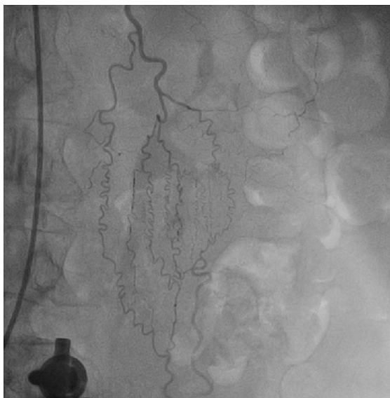
Figura 3 – ATIE com presença de circulação colateral.