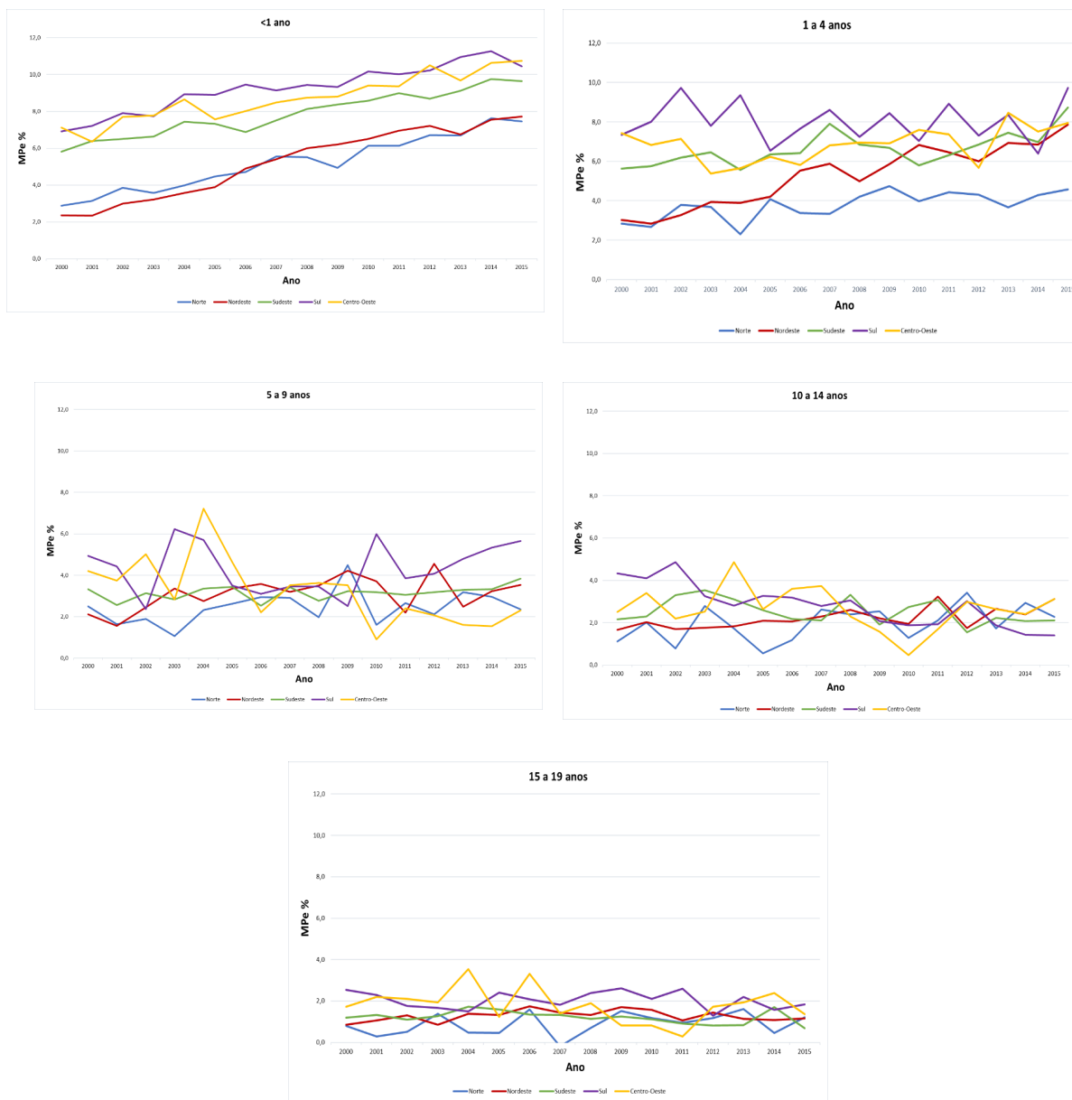
Figura 1 – Mortalidade proporcional endógena por malformações do aparelho circulatório por faixa etária e macrorregião do Brasil de 2000 a 2015. MPE=mortalidade proporcional endógena, mortalidade proporcional, excluídas as causas externas

do Brasil. O mesmo se aplica às demais causas de óbito. Entretanto, as evoluções das importâncias relativas dos grandes grupos de causas de óbito variaram de forma diferente com a progressão da idade, independentemente do sexo. Assim, as malformações, MAC e outras MC, diminuíram de importância com o aumento da idade nos menores de 20 anos de idade. Já com as DAC ocorreu o contrário, enquanto as causas externas descreveram um J, e as CMD pouco variaram com o máximo no grupo de 1 a 4 anos.