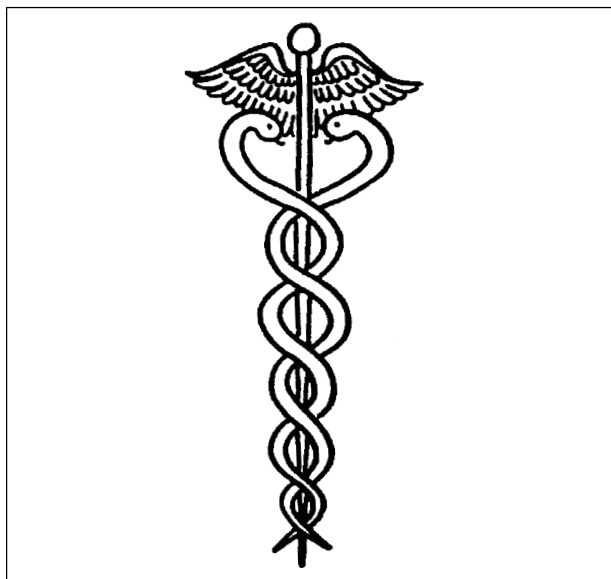
Fig. 1 - O caduceu de Mercúrio, símbolo do comércio